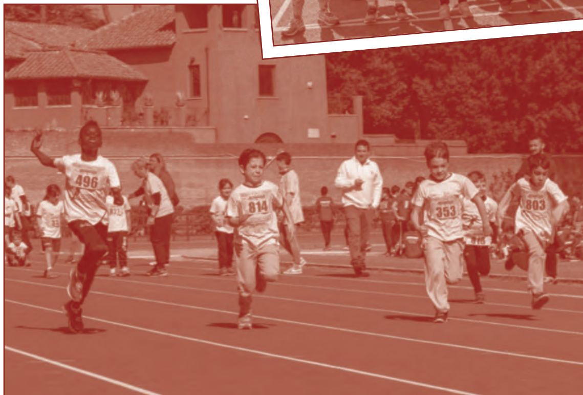
- Alcuni significative immagini delle "Menneadi 2016" -